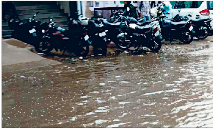
रेवाड़ी। बावल रोड पर बारिश के बाद एकत्रित पानी।

मौसम का मिजाज बार-बार बदल रहा है। कभी आसमान साफ हो जाता है, तो कभी अचानक बादल छा जाते हैं। सुबह के समय बारिश होने के बाद मौसम का मिजाज ठंडा पड़ गया। इसके बाद तेज धूप निकलते ही उमस भरी गर्मी ने जमकर पसीना छुड़ाया। लगभग आधे घंटे की बारिश में ही शहर में जगह-जगह जलभराव हो गया, जिससे लोगों को परेशानी का सामना करना पड़ा। मंगलवार से दो-तीन दिन तक मौसम में बार-बार बदलाव की संभावना जताई जा रही है। सोमवार को सुबह के समय आसमान साफ रहा। लगभग साढ़े 9 बजे अचानक तेज आंधी के साथ बादल छाए और आधे घंटे तक हल्की बारिश हुई। कुछ इलाकों में आकाशीय बिजली भी गिरी, परंतु इससे जानमाल का कोई नुकसान नहीं हुआ। बारिश के बाद आसमान पूरी तरह से साफ हो गया। अधिकतम तापमान 3.5 डिग्री सेल्सियस की कमी के साथ 35.0 डिग्री सेल्सियस पर आ गया। न्यूनतम तापमान 2.5 डिग्री बढ़कर 25.0 डिग्री सेल्सियस पर पहुंच गया। हवा में नमी का स्तर 35 प्रतिशत तक रहा, जबकि आंधी के बाद हवा की रफ्तार कम होकर 8 किलोमीटर प्रति घंटा तक आई। बीते साल 11 मई को अधिकतम