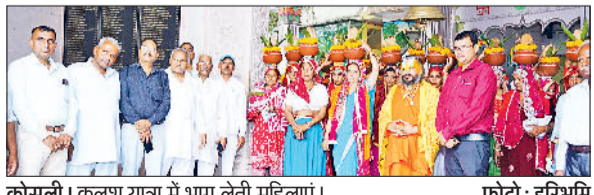
कोसली। कलश यात्रा में भाग लेती महिलाएं।