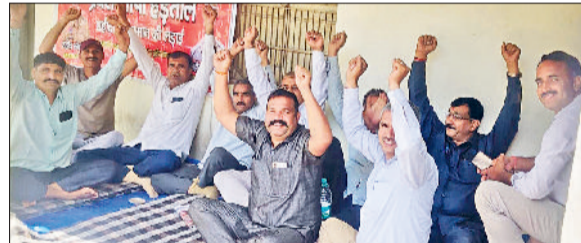
अग्निशमन कर्मियों का धरना जारी सरकार के खिलाफ जमकर नारेबाजी

संदिग्ध नंबरों से आने वाली कॉल पर व्हाट्सअप संदेशों को उपयोगकर्ता तक पहुंचने से पहले ही ब्लॉक कर देता है। एसपी ने कहा कि इससे ब्लैकमेलिंग, धमकी और साइबर ठगी जैसी घटनाओं पर काफी हद तक रोक लगेगी। साथ ही संदिग्ध नंबरों का डेटा बैकअप में सुरक्षित रहने से अपराधियों तक पहुंचना भी आसान होगा।