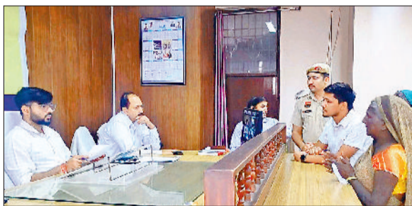
महेंद्रगढ़। लोगों की समस्या सुनते एसडीएम।