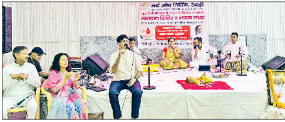
रेवाड़ी। रक्तदान शिविर के दौरान भजन संस्था में प्रस्तुति देते संस्था के सदस्य।