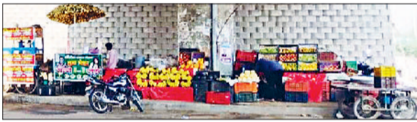
खोरी। फ्लाईओवर के नीचे एनएचएआई की जमीन पर लगी फड़ व रेहड़ियां।

रेवाड़ी-जैसलमेर नेशनल हाइवे के फ्लाईओवर के नीचे की जमीन दुकानदारों से लेकर एनएचएआई के कर्मचारियों तक के लिए फायदे का सौदा साबित हो रही है। पुलों के नीचे बड़ी संख्या में दुकानदारों ने फड़ लगाकर अतिक्रमण किया हुआ है। इससे पुलों के नीचे हादसों की आशंका भी बनी रहती है। जैसलमेर नेशनल हाइवे पर जिले की सीमा में चार ऐसे फ्लाईओवर पड़ते हैं, जिनके नीचे अंडरपास बने हुए हैं। इन अंडरपास से वाहन क्रॉस होते हैं। खोरी, कुंड और कुंड बैरियर के फ्लाईओवर के नीचे की जमीन पर