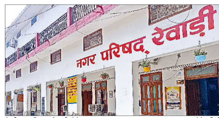
रेवाड़ी। नगर परिषद कार्यालय की फोटो।