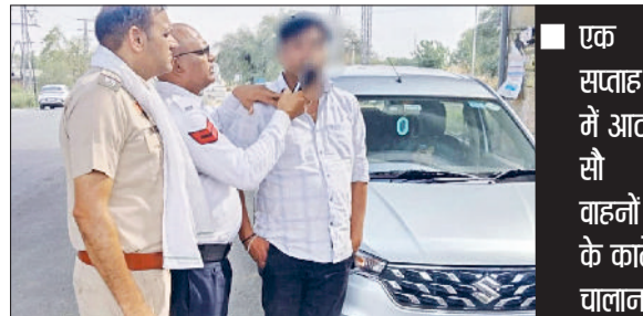
रेवाड़ी। विशेष अभियान के तहत वाहन चालकों की जांच करते पुलिसकर्मी।